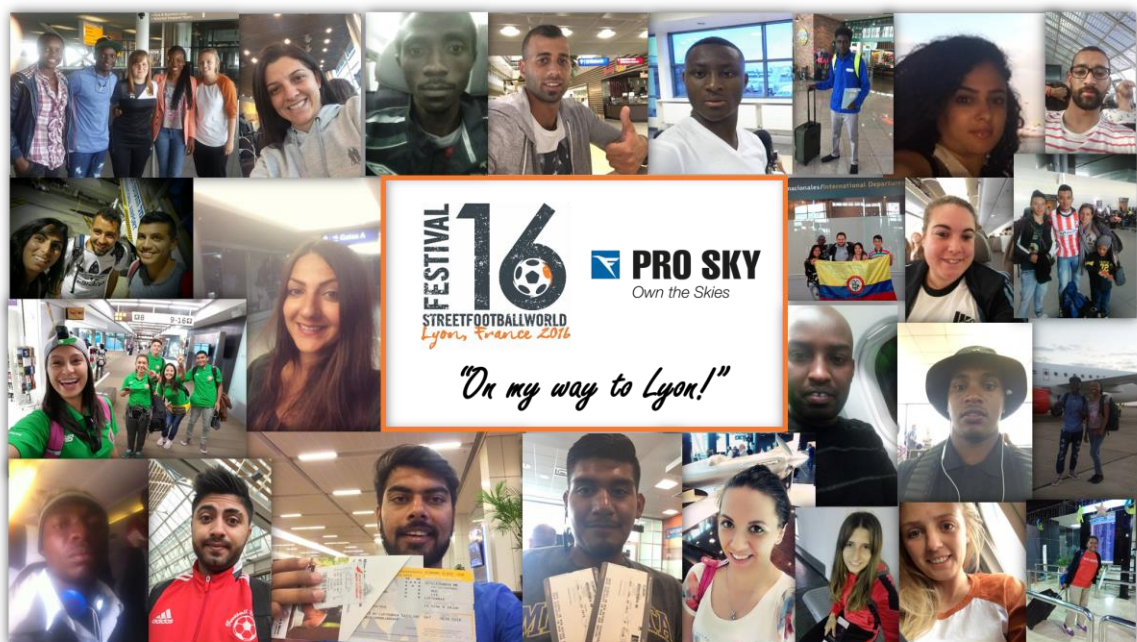
Selfie der Young Leaders vor dem Abflug nach Lyon, Frankreich // Bild: Pro Sky