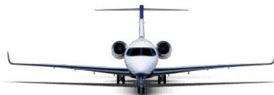
Cessna Citation Longitude