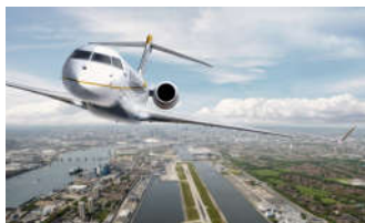
Bombardier Global 7000

In diesem Jahr haben uns unter anderem folgende neuen Flugzeuge besonders beeindruckt, die sich hervorragend für den Einsatz im Sektor VIP-Privatjets eignen: